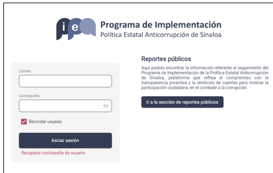
Ilustración 1. Sistema para Registro de Ejecución y Seguimiento del Programa de Implementación de la Política Estatal Anticorrupción (SIRES-PI-PEA)